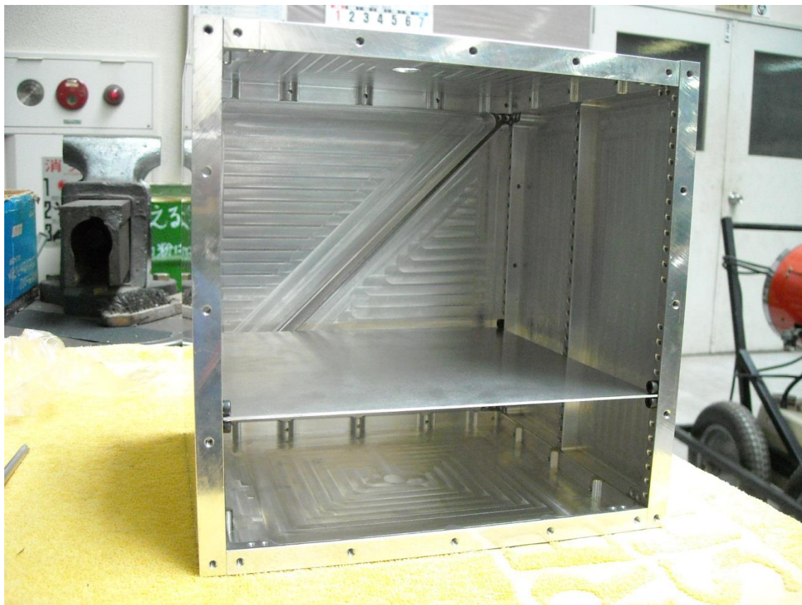
① 試作機 1 号の外観